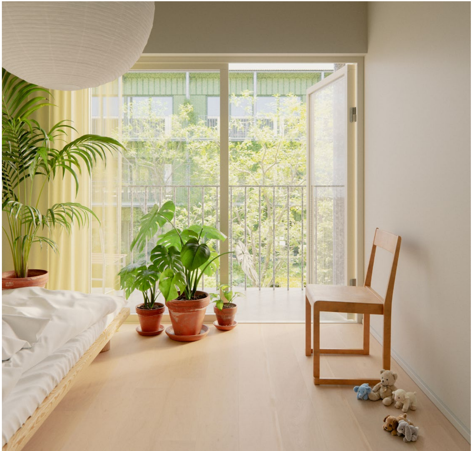
Vy från sovrum. (Visionsbild)