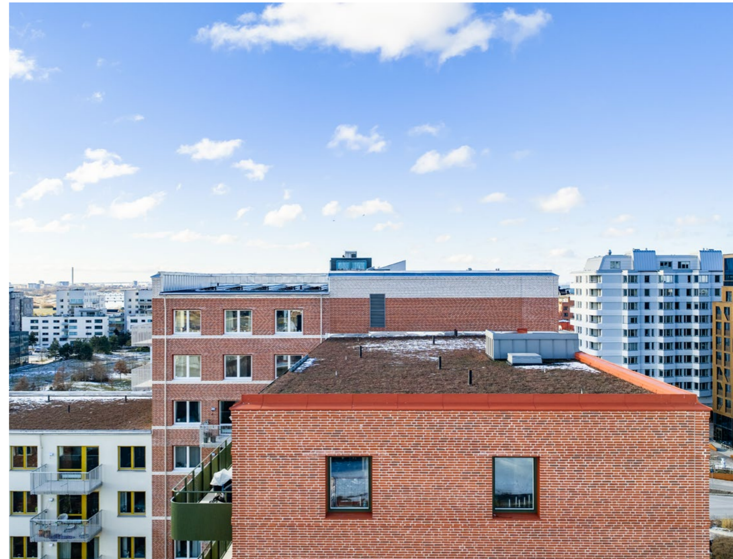
Utsikt, hus nr. 02, plan 3.